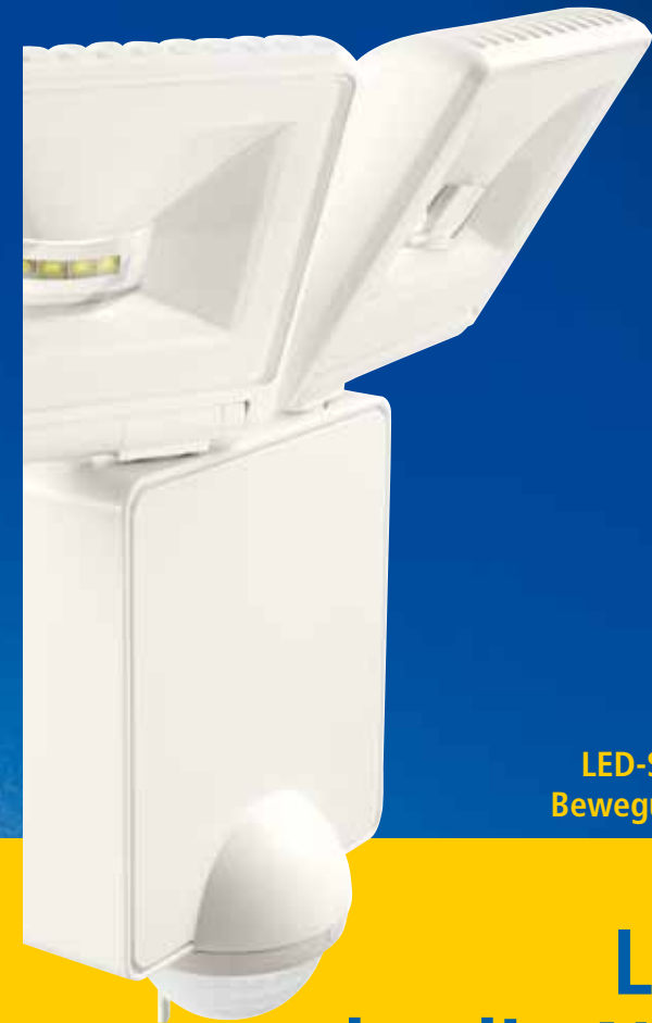
LED-Strahler mit Bewegungsmelder